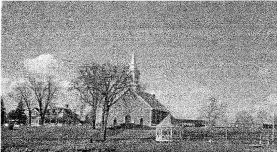
ÉGLISE DE ST PLACIDE CONSTRUITE EN 1851