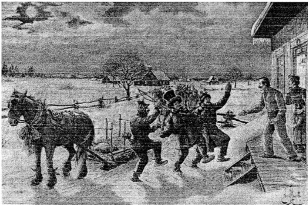
MARDI GRAS À LA CAMPAGNE

JOYEUX TEMPS DES FÊTES À VOUS CHERS MEMBRES ET À VOTRE FAMILLE.